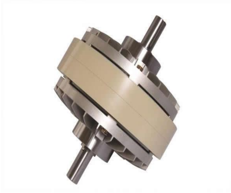
Şekil 1. UTK serisi manyetik tozlu kavrama.